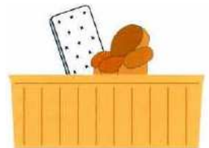
Benne à déchets encombrants

Pour les résidents de L'Isle-aux-Coudres un conteneur sera disponible du vendredi 21 au jeudi 27 mai 2010 , derrière l'édifice municipal. Vous apportez vos encombrants à l'intérieur du conteneur.